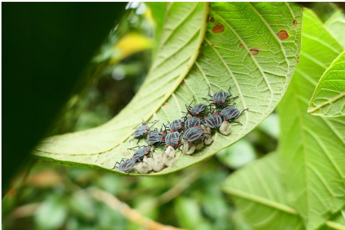
剛孵化的一齡若蟲體長約 5mm，呈現橢圓形，體色偏紅色至深灰色。