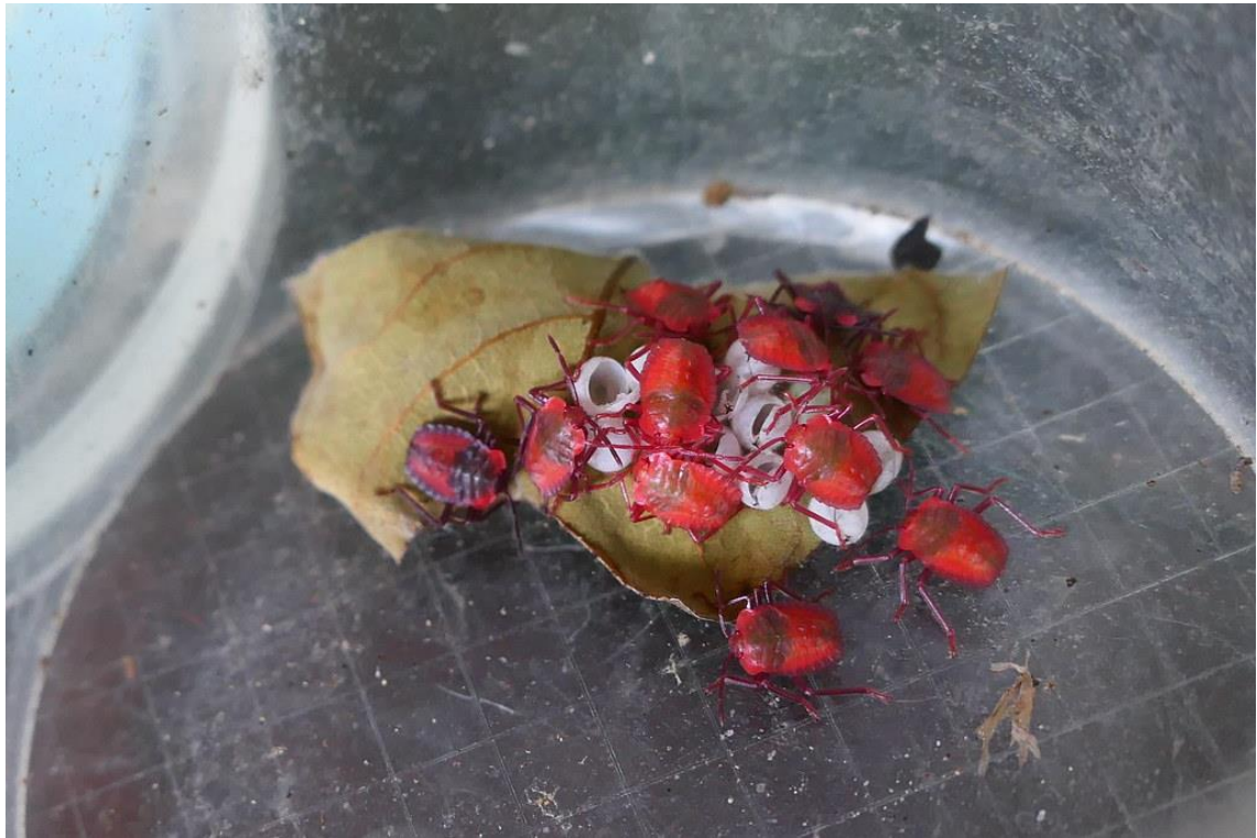
剛孵化的一齡若蟲體長約 5mm，呈現橢圓形，體色偏紅色至深灰色。